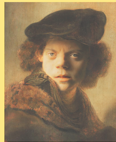
Andres Landert als Influencer im 17. Jahrhundert (Originalbild: REMBRANDT)