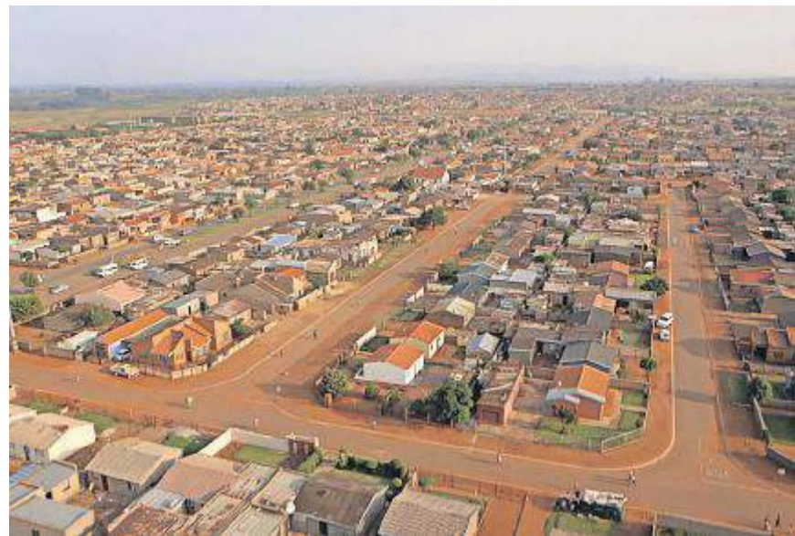
In Katlehong, einer Township nahe Johannesburg, wuchsen die Tänzer auf.

Die Tänzer der Gruppe Taxido gehören zur ersten Generation schwarzer Südafrikaner, die nach dem Ende der Apartheid aufwuchsen. Irene Loebell zeigt den Alltag dieser jungen Menschen, der von Arbeitslosigkeit, abwesenden Vätern oder HIV geprägt ist. «Per Gesetz sind die Schwarzen seit