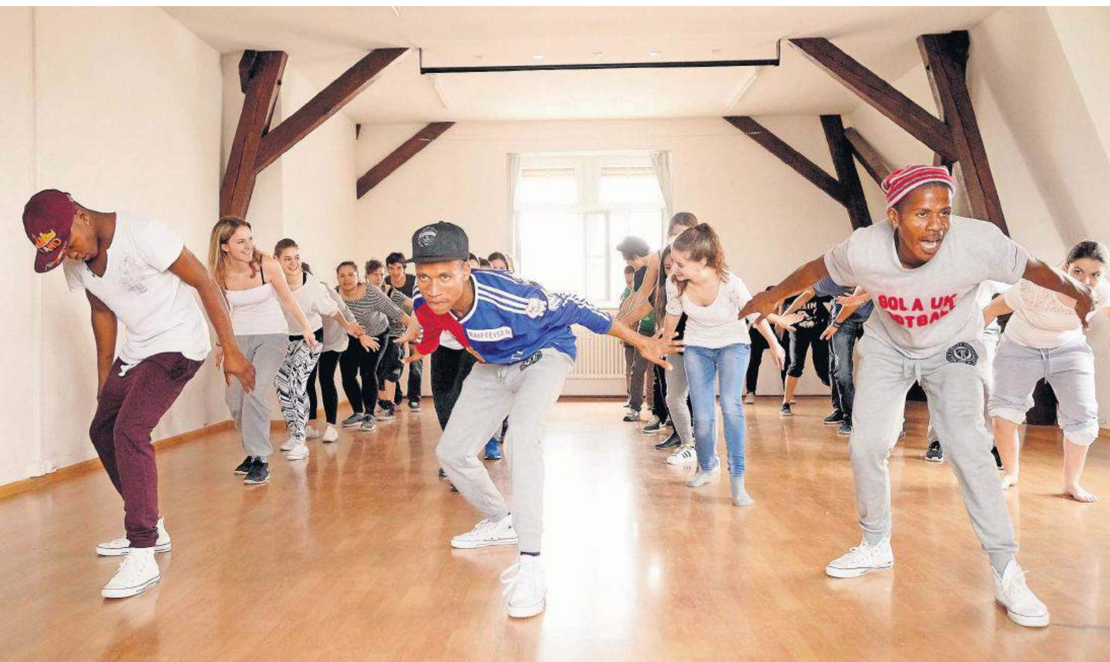
Der Film «Life in Progress» erzählt die Geschichte von Tshidiso (links) und Venter (Mitte). In Basel lehren sie Schülern den Township-Tanz Pantsula und diskutieren mit ihnen über Armut und Rassismus.

Austausch Der Dok-Film «Life in Progress» erzählt von südafrikanischen Jugendlichen – diese Woche besuchten sie Basel