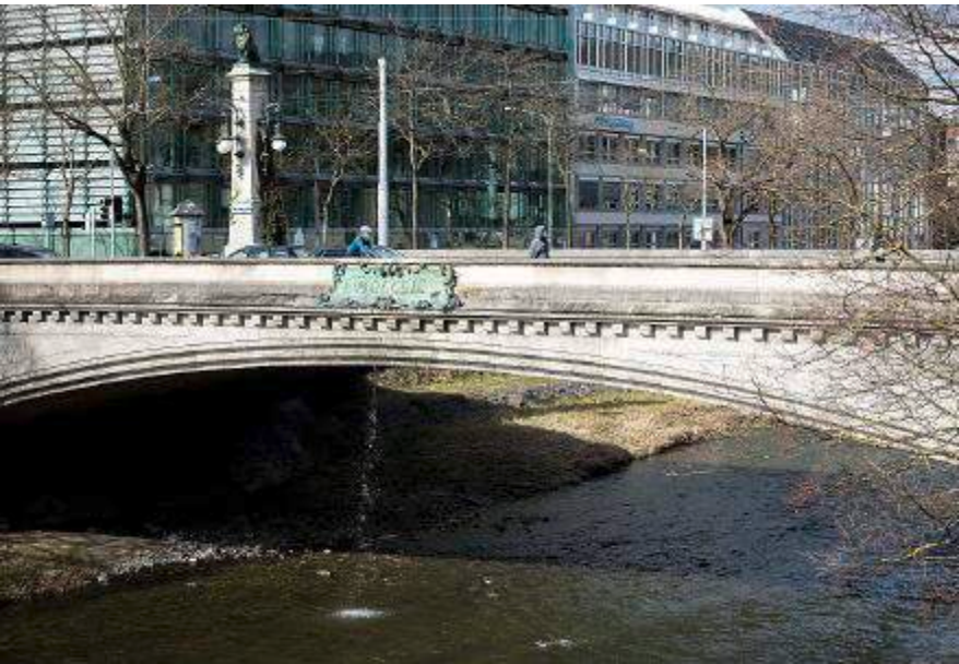
Begehrter Brunnen: Die plätschernde Stauffacherbrücke.

brücke, Selnaubrücke und Postbrücke. Die Stauffacherbrücke ist ein Spezialfall, wie Riccarda Engi sagt. Weil sich dort der Stetslauf in der Mitte der Brücke befindet, sieht man das Wasser sehr gut