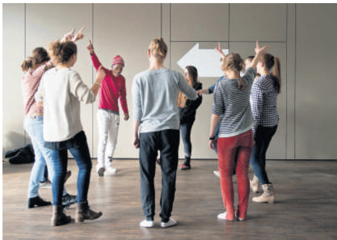
Szenenwechsel: Am Dienstag trainieren Taxido-Tänzer mit Zürcher Gymnasiastinnen.