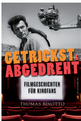
320 Seiten – Bloomsbury 2010 ISBN 978-3-8270-5350-3