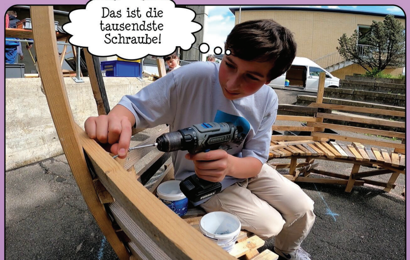
Damit es bequem ist, braucht es eine Lehne.