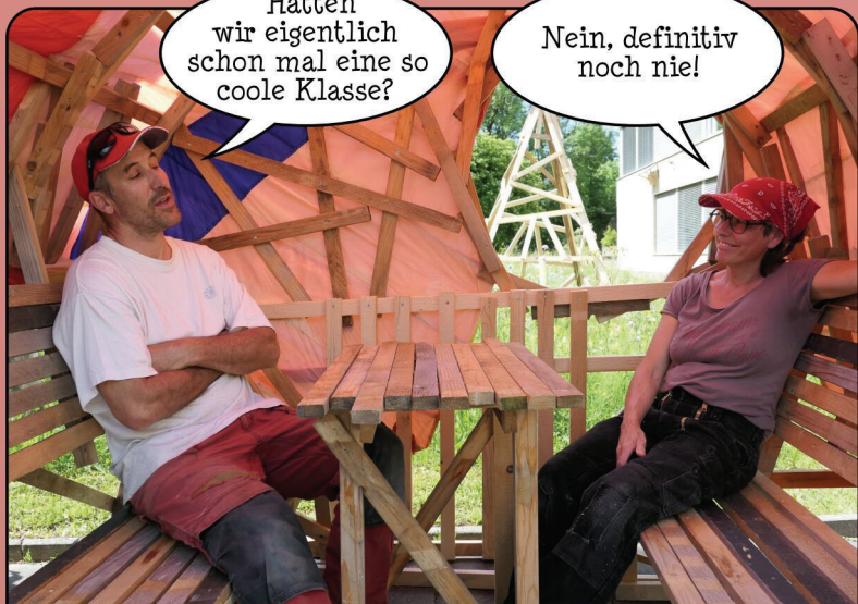
Die beiden Künstler sind sehr zufrieden mit den Zazous!