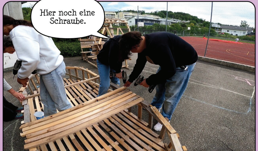
Im Schiff wird die Sitzbank montiert.