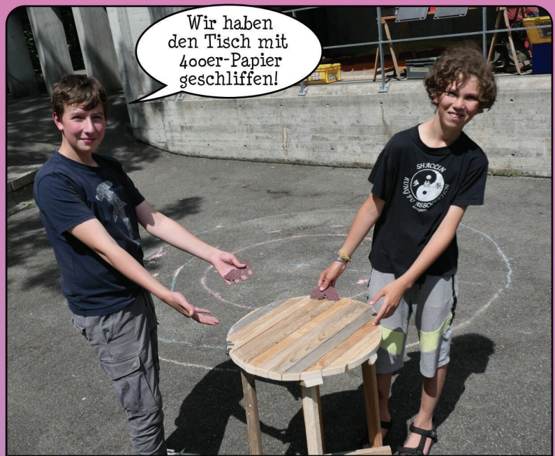
Der Tisch für die Hütte.