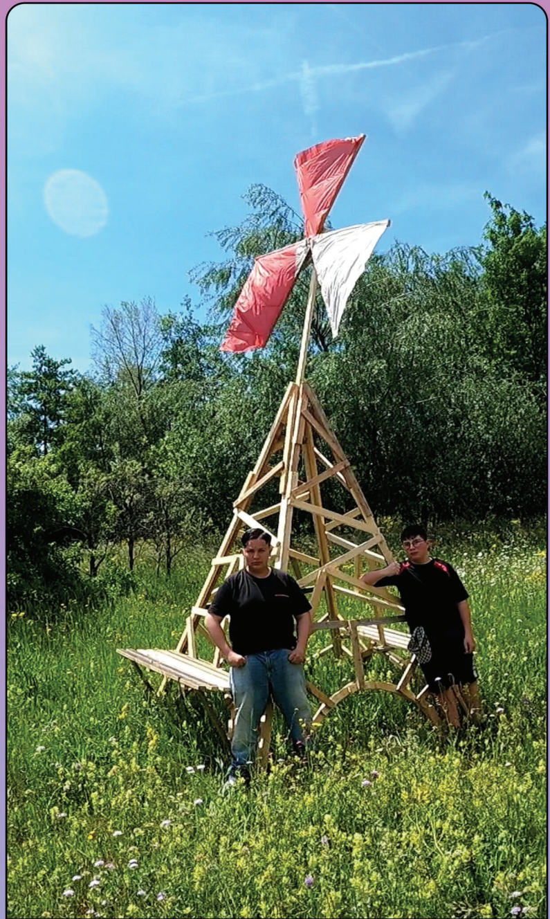
Der Eiffelturm an seinem endgültigen Platz.