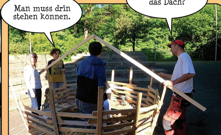
Aus dem Da Vinci Panzer wird nach und nach ein gemütliches Häuschen.