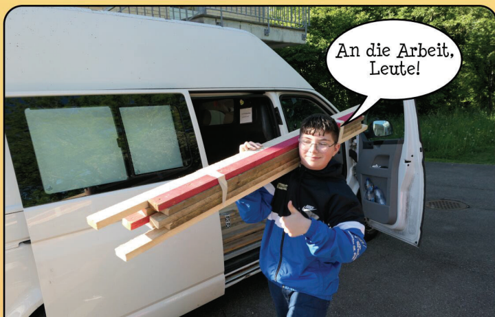
Voll motiviert starten wir in den zweiten Tag...