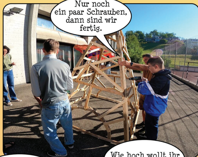
Wie hoch wollt ihr das Dach?