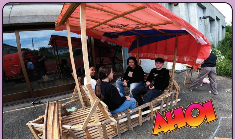
Das Schiff bekommt ein hübsches Dach.