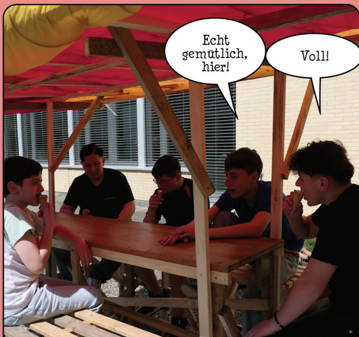
Zum Abschluss gibt's das wohlverdiente Glacé.